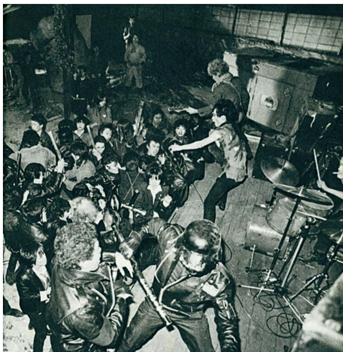
Burst City (1982)

Tsukamoto, qui avait fréquenté la même université qu'Ishii, puisera d'ailleurs dans l'énergie effrénée de son aîné dès The Phantom of Regular Size (1986) et The Adventures of Electric Rod Boy (1987), puis plus clairement encore dans Tetsuo: The Iron Man (1989) et Tetsuo II: Body Hammer (1992). Il combinera alors l'emportement punk d'Ishii et le théâtre expérimental (notamment la tradition butoh ), tout en s'alimentant à l'avant-garde et aux sonorités industrielles de l'époque. De la motocyclette à l'homme de fer, comme de la guitare électrique au marteau-piqueur, le cinéma d'Ishii fera, par l'entremise de celui de Tsukamoto, un pas de plus vers le futur. 24