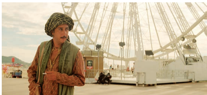
Les Mille et une nuits (2015)