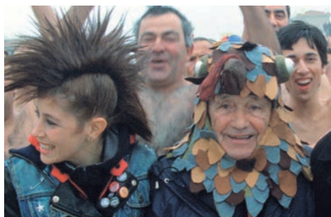
Les Mille et une nuits (2015)

cette histoire ne les tienne plus en haleine. Miguel Gomes s'est mué en Shéhérazade, il l'a peut-être toujours été. Fin du prologue. Le film peut commencer... et Les Mille et une nuits réenchanter notre monde.