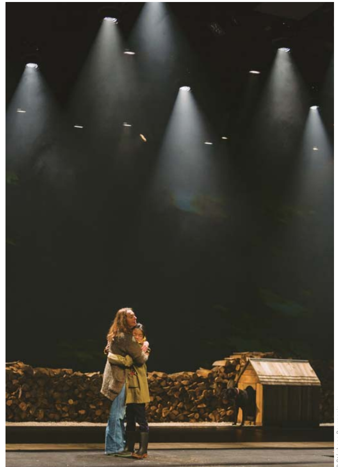
Les bons débarras