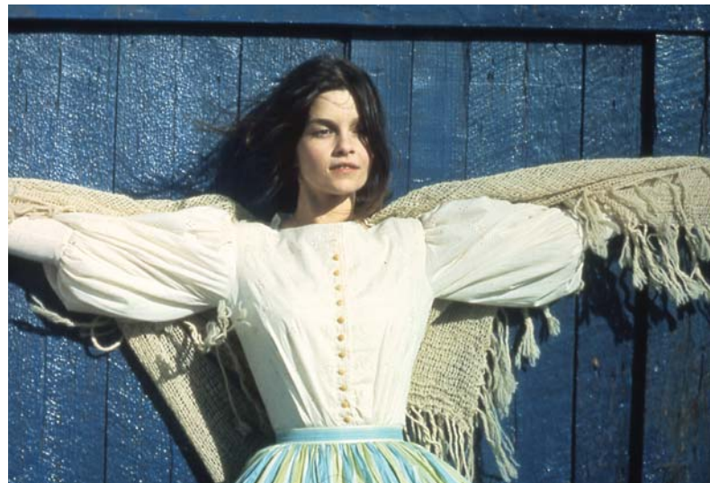
Haut : Ma nuit chez Maud (Éric Rohmer) – Bas : Heaven's Gate (Michael Cimino) et Kamouraska (Claude Jutra)