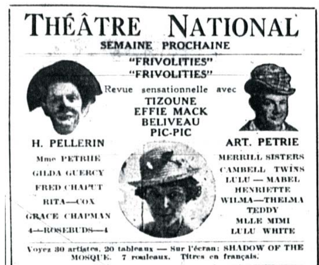
La Presse (6 septembre 1930): 73 (BANQ)