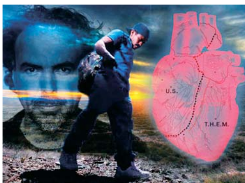
Carne y Arena de Alejandro González Iñárritu (2017)

un morceau de tôle rouillée, présenté comme «un vrai morceau du mur qui sépare les États-Unis du Mexique». La dimension politique de l'œuvre est ainsi affichée d'emblée et la consigne est simple: se dépouiller de tout appareil de festivalier cannois (badges, sacs et téléphones) et retirer ses chaussures.