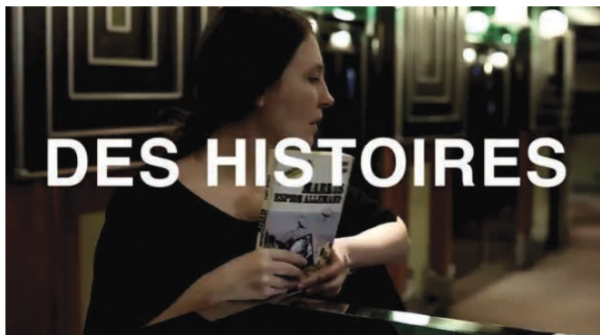
Film Socialisme de Jean-Luc Godard

Le cinéma est une expérience intérieure, pas un objet programmé pour être exposé à la consommation. Il n'a aucune existence propre en dehors de cette expérience très intime, cet en-commun troublant, des cinéastes et des spectateurs du monde entier.