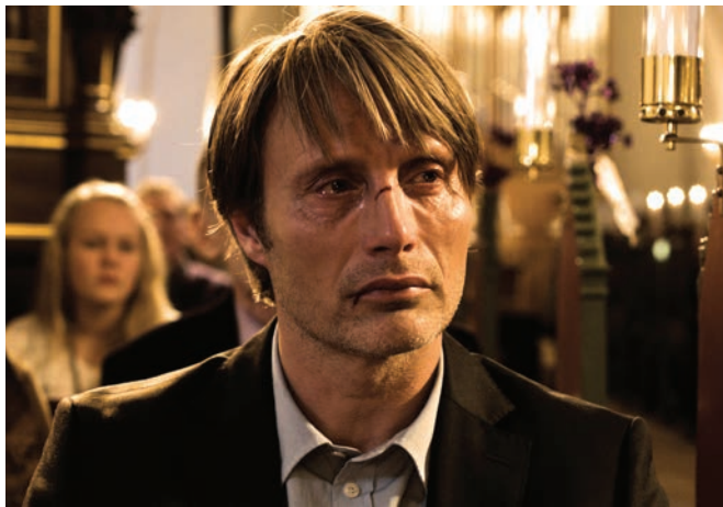
La chasse de Thomas Vinterberg

en Arkansas, grâce au jeu nuancé de Matthew McConaughey qui sauve la mise avec son personnage romantique d'amoureux et d'homme traqué en quête de pardon et de la figure des deux jeunes garçons eux aussi en mal d'amour. Mais on reste dubitatif sur la lecture que l'on peut faire de ce film gentil. Par contre, même si Nicole Kidman vient à sa rescousse, ce même Matthew