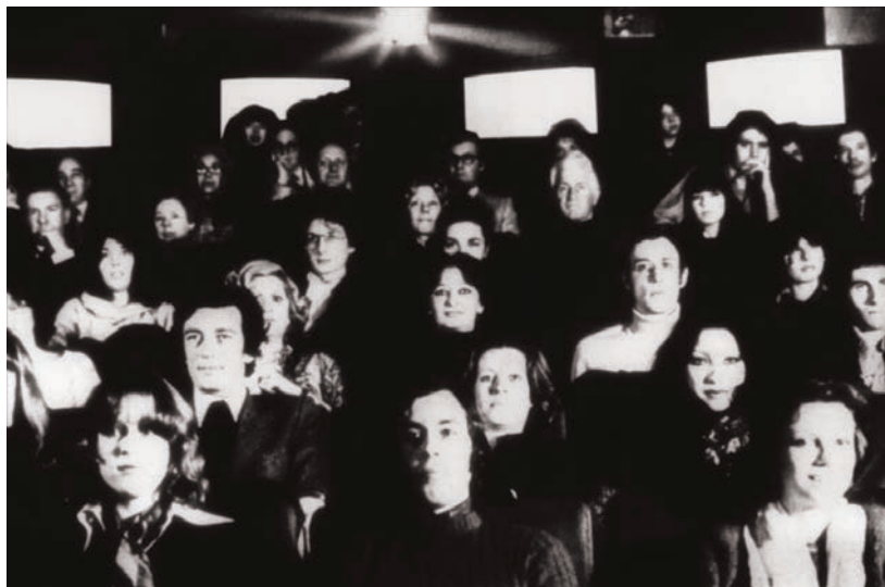
IN GIRUM IMUS NOCTE ET CONSUMIMUR.IGNI (1978) de Guy Debord

Tout transparent, tout est ouvert et tout est infini, entre ceux qui consomment intensément. Georges Bataille