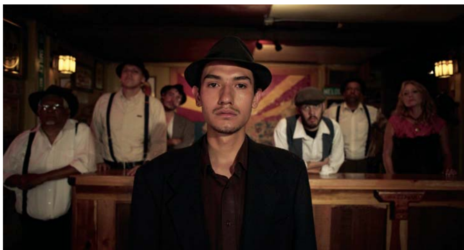
↑ Bisbee '17 (2018) → → Actress (2014)