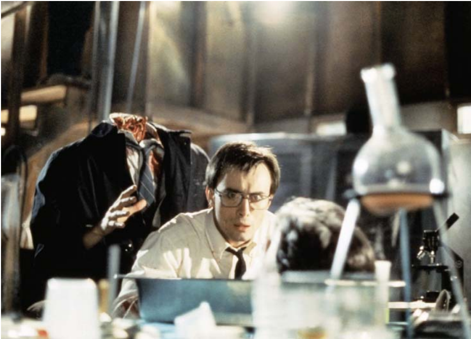
↑ Re-animator de Stuart Gordon (1985) → Haunted Palace de Roger Corman (1963)