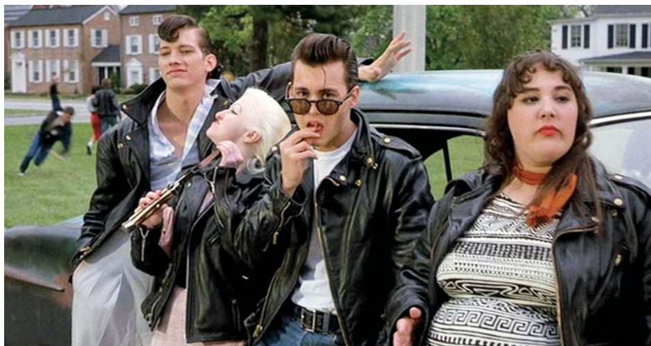
↑ Cry Baby de John Waters (1990) → Yellow Submarine de George Dunning (1968) → Jailhouse Rock de Richard Thorpe (1957)