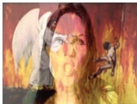
Photomontage: Denis Laramée