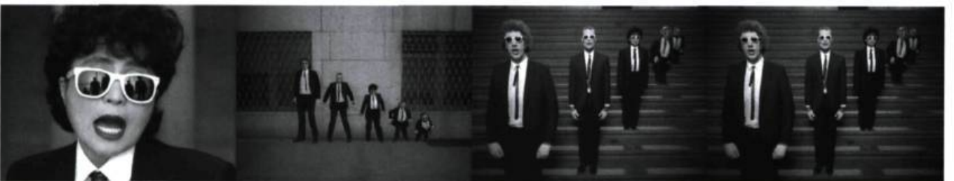
Tango (1980), Imagine (1986), The Fourth Dimension (1988), Steps (1987), Sign of the Times (1984) – vidéoclip de Grand Master Flash, Hell in Paradise (1986) – vidéoclip de Yoko Ono.