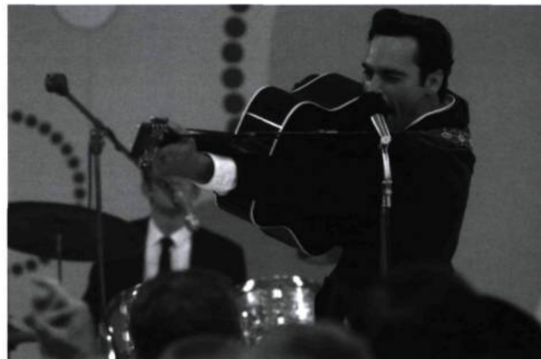
Joaquin Phoenix dans la peau de Johnny Cash dans Walk the Line de James Mangold.

C'est donc à l'écart des blockbusters que les acteurs s'éclatent et, surtout, qu'ils parviennent à se faire un nom. Car son Oscar remporté pour sa prestation dans un film à petit budget (8 millions), Charlize Theron le rentabilise en tenant le rôle titre de Aeon Flux (budget de 62 millions). Idem pour Halle Berry qui obtient la pré-