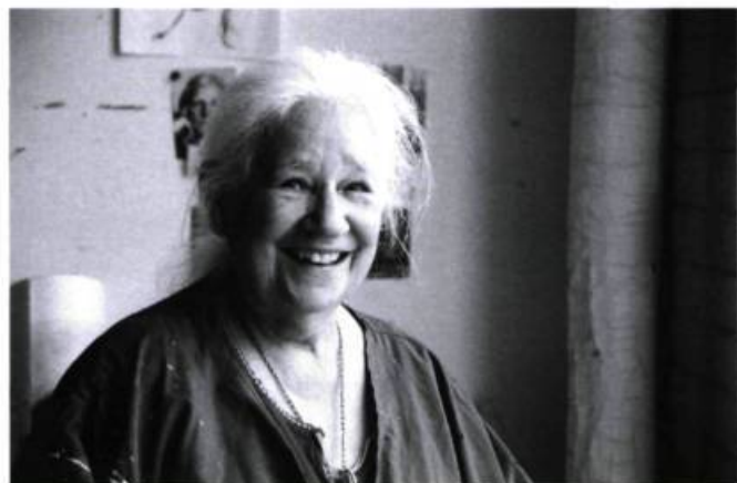
À force de rêves de Serge Giguère

À l'évidence conquis par l'Afrique noire qu'il avait si bien filmée (en Guinée) pour son très beau La main invisible , Sylvain L'Espérance nous ramène sur le continent pour nous faire faire connaissance avec le grand fleuve Niger. Se présentant par la voix du cinéaste comme « un portrait humain du fleuve », le film se construit au rythme des rencontres avec les riverains qui nous parlent de leur vie, de leur travail et de leur lien avec le fleuve dont la crue est pour eux un véritable moteur de vie. Qu'il s'agisse de la construction d'une pirogue, dont le secret est un précieux héritage familial, ou des mœurs des poissons, savamment décrites par celle qui les vend au marché de Mopti depuis quarante-trois ans, tout nous est dit par les Maliens eux-mêmes – les interventions parlées du cinéaste se limitant à deux courts textes informatifs en voix off. Le spectateur est invité à découvrir le fleuve et ses habitants à travers l'œil du