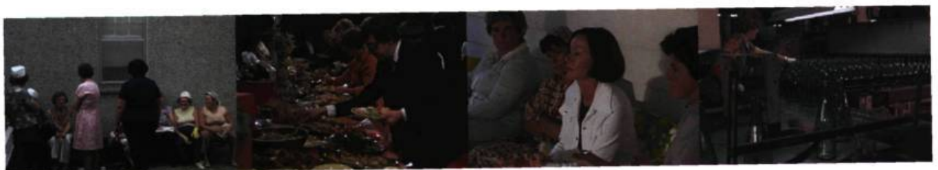
«Chronique de la vie quotidienne» Mercredi, petits souliers, petit pain (1977)