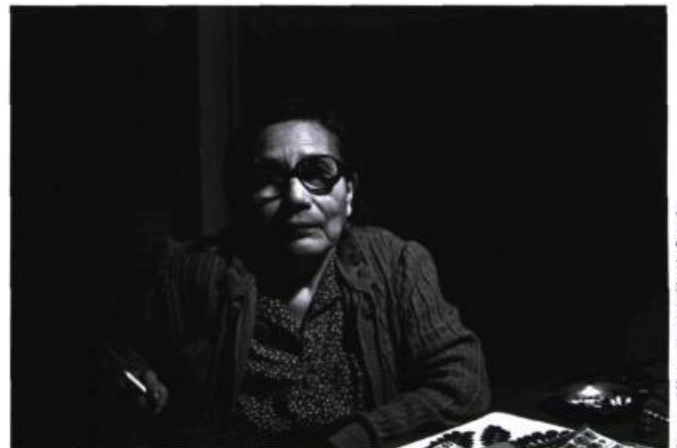
Le dernier glacier (1984)

Vous semblez avoir une manière assez unique de travailler. Je pense entre autres à la façon dont vous avez conçu Trois pommes... en élaborant en même temps l'histoire, la musique, la conception sonore. Cette méthode est-elle unique à ce film?