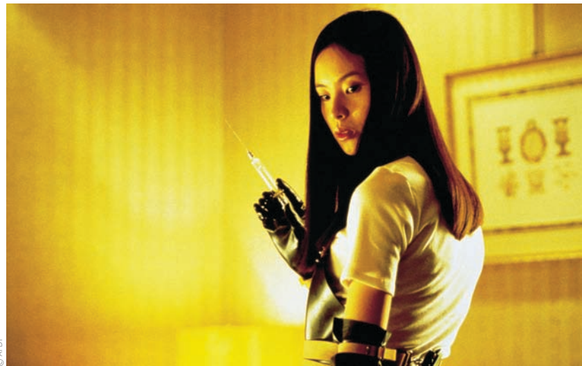
Audition (1999) de Takashi Miike

portrait réaliste d'une famille en détresse et n'hésite pas à critiquer la politique de son pays, il demeure d'abord et avant tout un film de monstres, celui-ci trônant au centre de l'œuvre, en digne meneur de l'action. Dans sa première scène où un scientifique américain ordonne que des déchets chimiques soient jetés dans la rivière Han à Séoul, le réalisateur laisse planer l'ombre de Godzilla, se réclamant fièrement d'une tradition de films qui ne sont pas reconnus pour leur originalité. Avec sa prémisse familière – une créature monstrueuse garde une jeune fille prisonnière, poussant la famille de l'enfant à aller à sa recherche –, et malgré un dénouement inat-