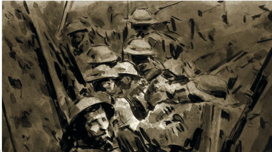
© Office national du film du Canada La tranchée de Claude Cloutier (2010)