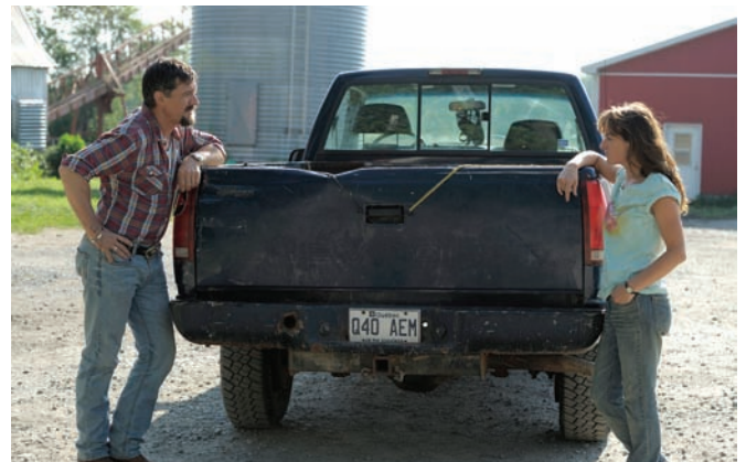
Nuit # 1 (2011) d'Anne Émond et Marécages (2011) de Guy Édoin