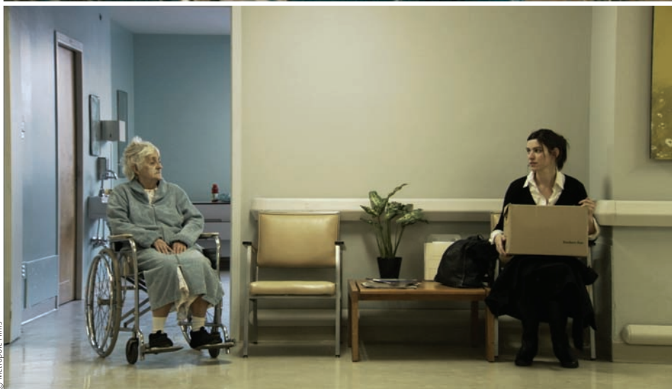
Jo pour Jonathan (2011) de Maxime Giroux et Les signes vitaux (2009) de Sophie Deraspe

ritoire. Ils montrent ce qu'ils connaissent : Ouellet filme Dégelis, son village; Verreault et Bernadet arpentent la banlieue de leur enfance; Galiero, Giroux et Lafleur filment probablement les banlieues pavillonnaires qu'ils ont habitées, etc.