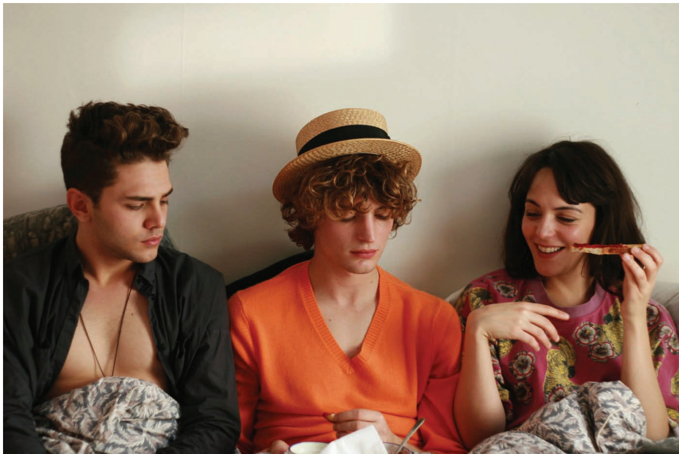
Les amours imaginaires (2010) de Xavier Dolan

La version longue du débat sera publiée dans le numéro de la revue électronique Nouvelles vues sur le cinéma québécois portant sur le renouveau, n° 12, printemps-été 2011.