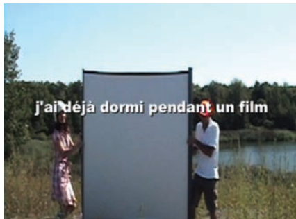
Le soleil brille pour tout le monde mais les hommes préfèrent les blondes (2008) de Sylvie Laliberté

Il y a dans ce Mémorial une salle où siègent des bustes de personnages historiques de l'époque. Sur chacun est projeté le visage d'un habitant marseillais anonyme d'aujourd'hui.