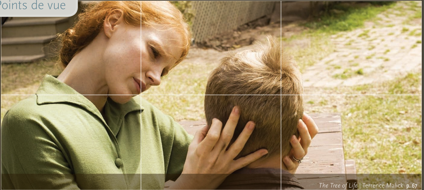
The Tree of Life | Terrence Malick p. 67