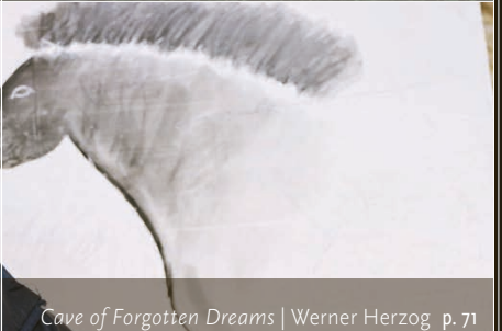
Cave of Forgotten Dreams | Werner Herzog p. 71