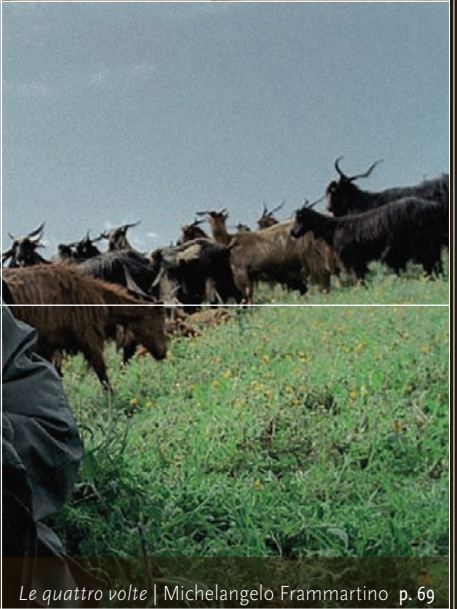
Le quattro volte | Michelangelo Frammartino p. 69