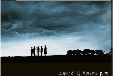
Super 8 | J.J. Abrams p. 70