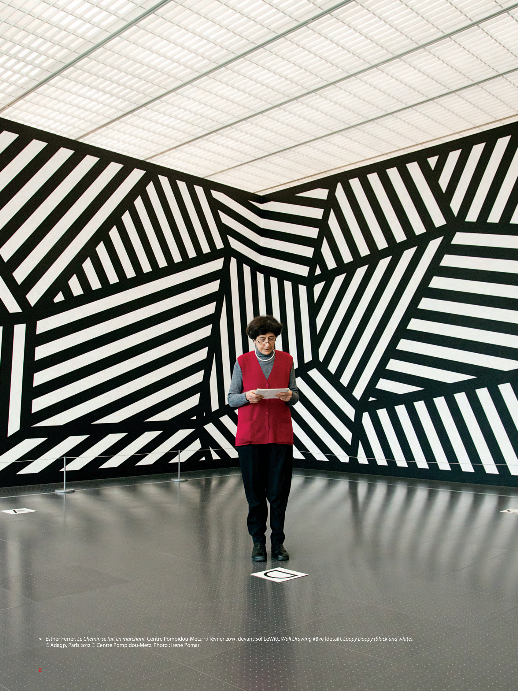
> Esther Ferrer, Le Chemin se fait en marchant , Centre Pompidou-Metz, 17 février 2013. devant Sol LeWitt, Wall Drawing #879 (détail), Loopy Doopy (black and white) . © Adagp, Paris 2012