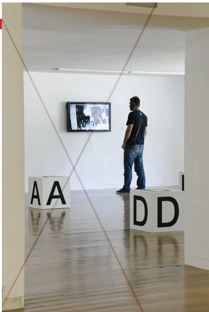
> Installation Parcourir un carré de toutes les manières possibles (détail), CEGAC Centro Gallego de Arte Contemporáneo, Santiago de Compostela, 2012.