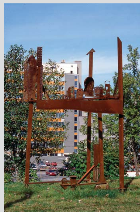
> Thelonious Monk . Acier, 365 x 213,4 x 183 cm, 1993.