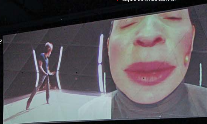
> Liquid Loft, Talking Head.

Nombre de pratiques en arts multidisciplinaires et électroniques placent en effet l'individu au cœur de leur démarche. Que ce soit dans une perspective relationnelle ou réflexive, comment les questions de l'identité individuelle ou de l'intimité s'expriment-elles dans les arts hybrides ? Comment se définissent nos rapports au quotidien et à ses objets ?