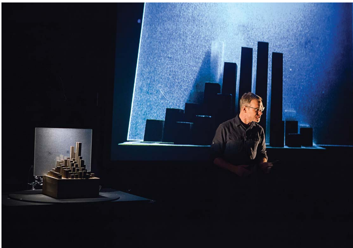
> Théâtre de la Pire Espèce, Villes , collection particulière.

aux ramifications inédites sur plusieurs plans de réalité, celles cannibales, d'autres faites de verre, de sable... Il y a la ville des monstres, la ville fantôme, la ville double. Il y a enfin des villes qui portent des noms de femmes, comme autant de métaphores de leur proverbiale complexité, avec toutes les promesses qu'elles recèlent.