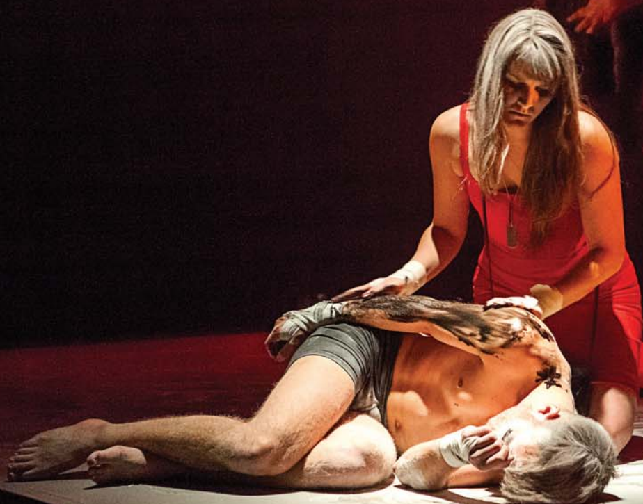
> Liquid Loft, Radical K.O.

Nombre de pratiques en arts multidisciplinaires et électroniques placent en effet l'individu au cœur de leur démarche. Que ce soit dans une perspective relationnelle ou réflexive, comment les questions de l'identité individuelle ou de l'intimité s'expriment-elles dans les arts hybrides ? Comment se définissent nos rapports au quotidien et à ses objets ?