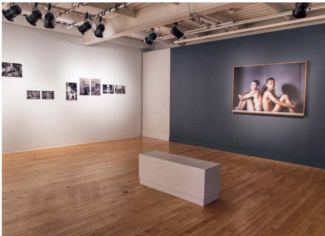
> Charinthorn Rachurutchata et Miti Ruangkritya, VU Photo.