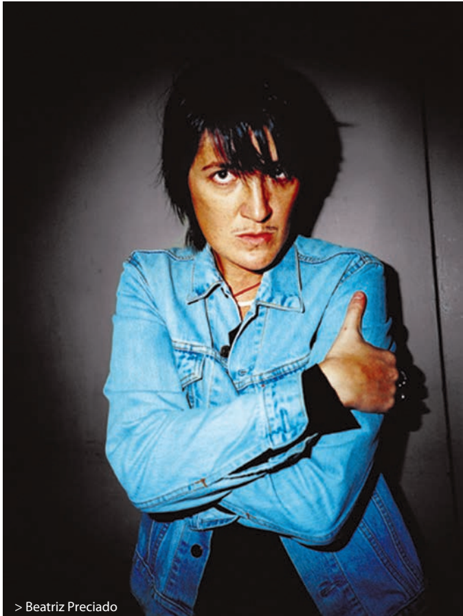
> Beatriz Preciado