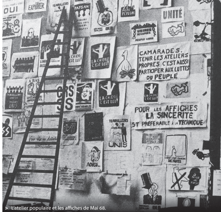
> L'atelier populaire et les affiches de Mai 68.

La production d'affiches militantes et publicitaires de Vladimir Maïakovski est abondante. Dès le début de la révolution d'Octobre, en l'absence de journaux étant donné la crise du papier, Maïakovski a œuvré jour et nuit pour réaliser, avec quelques amis, des affiches