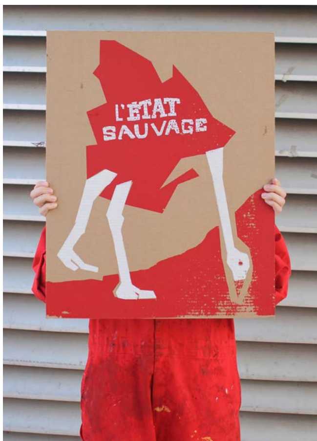
> École de la Montagne Rouge, pancarte L'état sauvage.