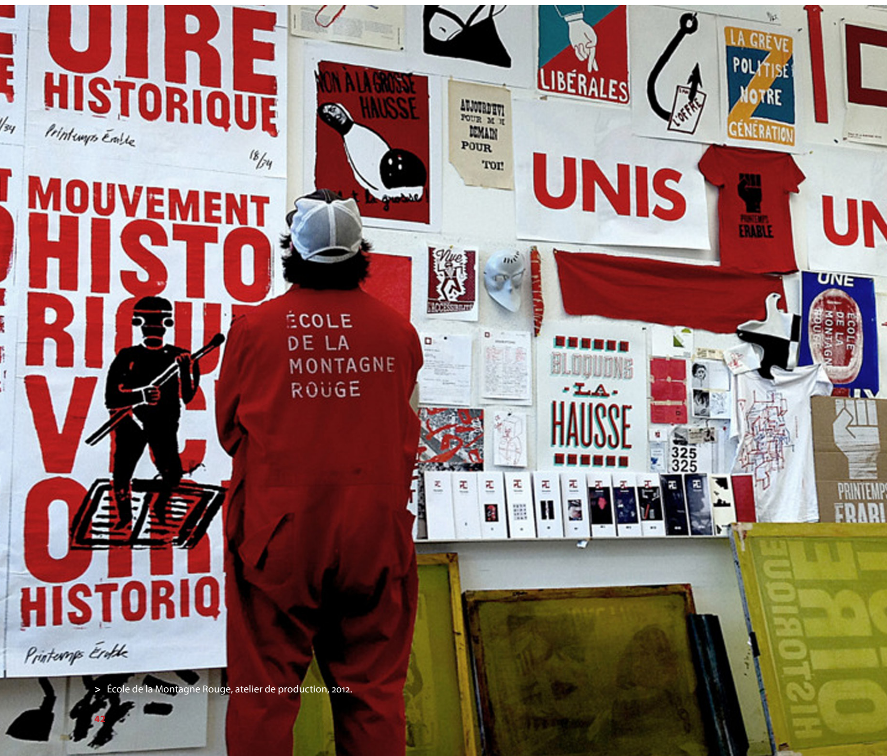
> École de la Montagne Rouge, atelier de production, 2012.

Les milliers d'affiches imprimées pendant le Printemps québécois ne seront jamais signées, les auteurs assumant l'anonymat de leur production. À l'instar des créateurs de l'Atelier populaire de l'École des beaux-arts au mois de mai 68 à Paris, les créateurs du Printemps québécois travaillaient dans l'anonymat. Les affiches de Mai 68 étaient des œuvres collectives faites par les étudiants et tous ceux qui passaient dans l'atelier, artistes, ouvriers en grève, militants, etc. Sur la porte de l'Atelier, on pouvait lire un écriteau révélant l'esprit de l'époque : « Atelier populaire : oui, atelier bourgeois : non. »