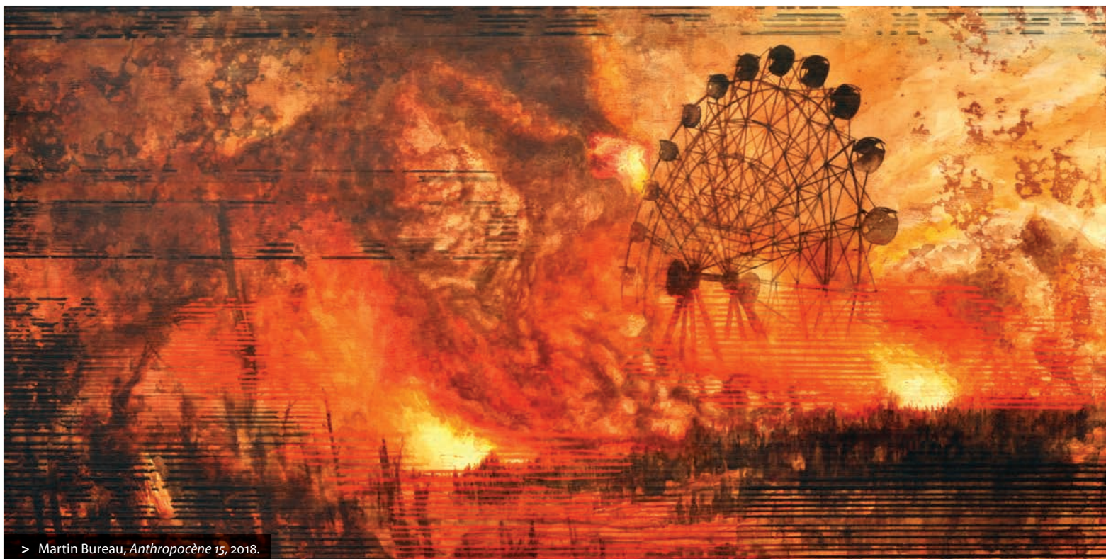
> Martin Bureau, Anthropocène 15 , 2018.