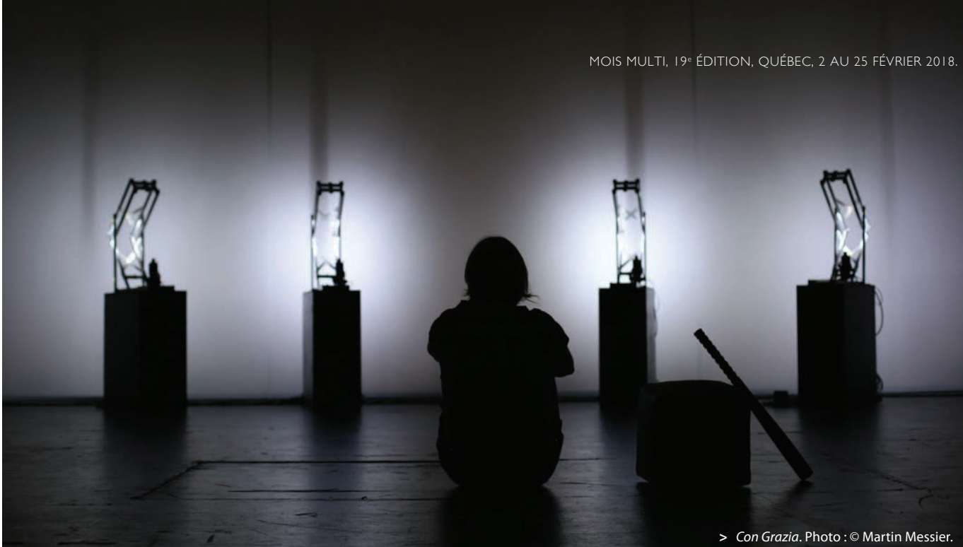
> Con Grazia .