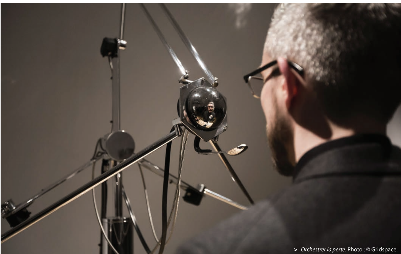
> Orchestrer la perte .