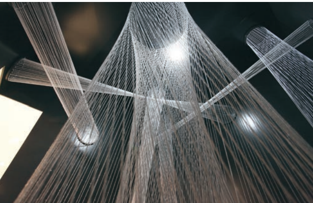
> Valérie Potvin, 2 km.