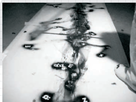
> Julien Blaine, La pythie claustrophobe , 1969.