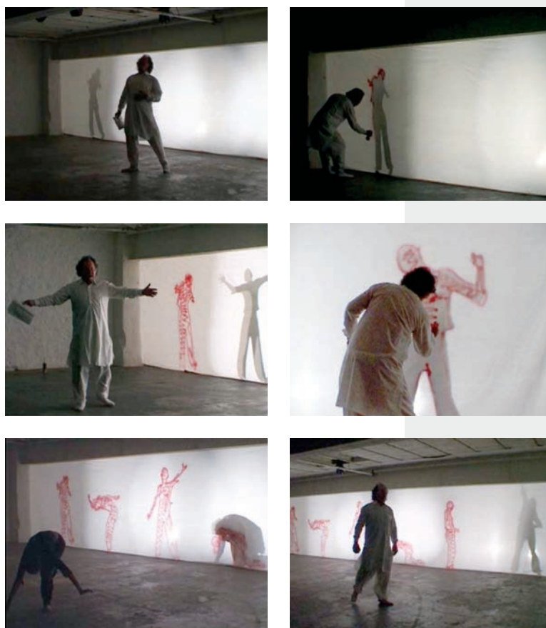
> Julien Blaine, Pression im/pression sur/impression , 1972.

Pendant le déroulement de la performance La pythie claustrophobe , l'artiste dit : « Claustrophobe dans 1 km d'eau, et dans 60 cm de mer, et par conséquent claustrophobie dans une pièce de 2 m sur 2 m, et par conséquent claustrophobie dans un parallélepède de 20 m 2 , par conséquent claustrophobie dans une île, et par conséquent claustrophobie... comment sortir, comment sortir la folle de sa gangue ? »