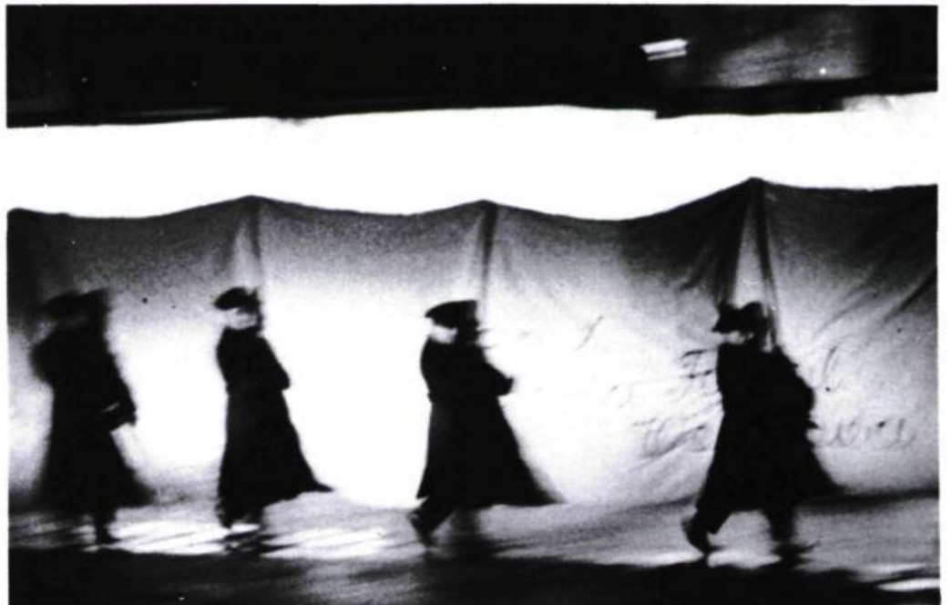
Tadeusz KANTOR, Happening La Lettre, Varsovie, 1967.