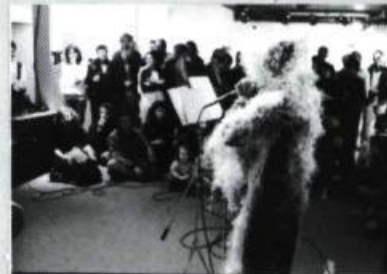
L'ABOMINABLE HOMME DES LETTRES Lecture instrumentale.