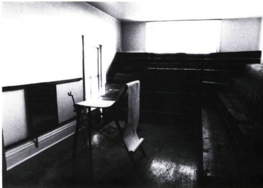
Bureau gynécologique, 2 e étage, Le Musée des Sciences, 1983-84

Pour ce qui est de la stratégie de site, les réalisatrices ont choisi d'intervenir dans un lieu non muséologique — une succursale postale désaffectée — situé dans un quartier économiquement défavorisé. Ce choix a permis d'atteindre un public plus hétérogène que celui qui fréquente habituellement les musées. Les artistes ont en outre opté pour un édifice néo-classique dont l'architecture rappelle sans équivoque le Musée des beaux-arts de Montréal. La référence architecturale à l'institution muséale a eu pour effet d'inciter les spectatrices à démarrer