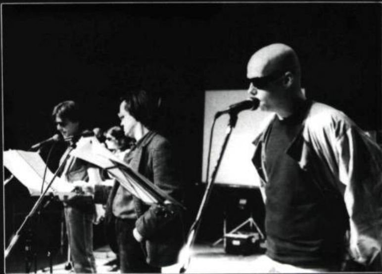
The Woeurks, de Gilles Arteau.