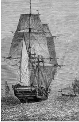
Le Beagle , à bord duquel Darwin et le capitaine Robert Fitzroy voyagèrent autour du monde de 1831 à 1836.

Le collage elliptique propose de manière impressionniste des éléments de débat autour de la modification du génome, du refus du vieillissement ou de l’immortalité, sur un ton ludique. Inévitablement, le propos autour de Darwin nous ramène au cœur de l’espèce. Qu’est-ce qu’un humain ? Le cerveau d’un être humain s’explique comment ? Comment évaluer le statut de l’humain parmi les autres mammifères ? Que nous apportent de doutes, de craintes, de réflexions, les dernières recherches en biologie moléculaire ?