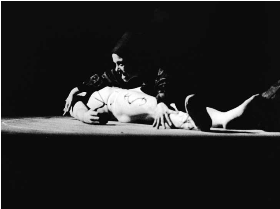
Frankenstein (Living Theatre, 1965).

Ce dernier exemple rappelle que de grandes figures de l'histoire des sciences ont servi de catalyseurs à des fictions, soit par leur présence, soit par leurs découvertes servant d'embrayeurs narratifs. Les deux plus populaires chez les écrivains et les dramaturges sont certainement Albert Einstein et Charles Darwin. C'est sur une expérience autour de ce dernier que je voudrais m'arrêter.