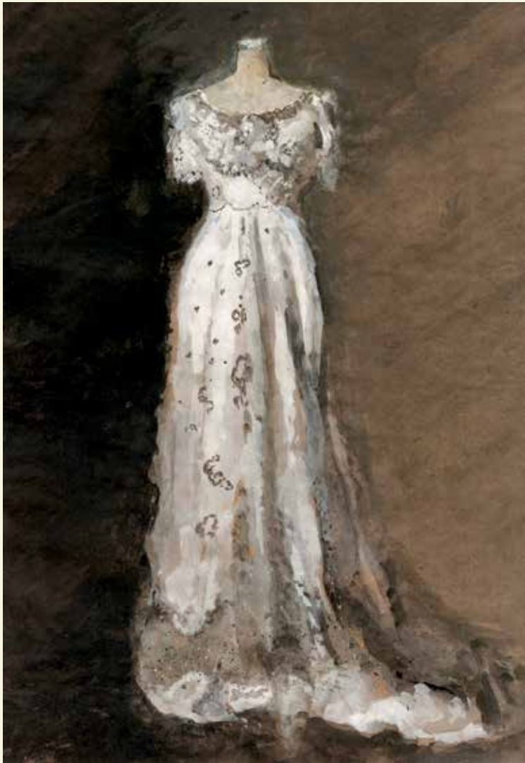
Recherche pour une robe, 1979. Gouache. © Véronique Borboën