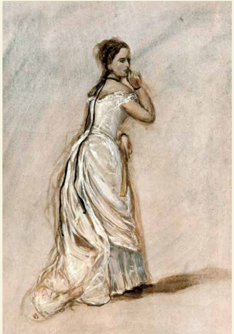
Je vous écris du Caire (Théâtre d'Aujourd'hui, 1993). Huile sur carton.

à un public contemporain. La prémisses est louable, encore ne faut-il pas sous-estimer le public. Il sera toujours contemporain, ce qui ne veut pas dire qu'il faut lui donner ce qu'il s'attend à voir. Ariane Mnouchkine soutient qu'il n'y a pas un grain de poussière sur les œuvres qui ont survécu au temps, que la poussière se trouve plutôt dans nos têtes.