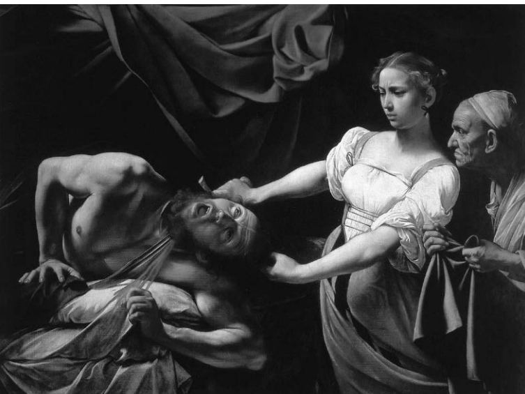
Le Caravage, Judith et Holopherne , 1598. Galerie nationale d'art ancien, Rome.