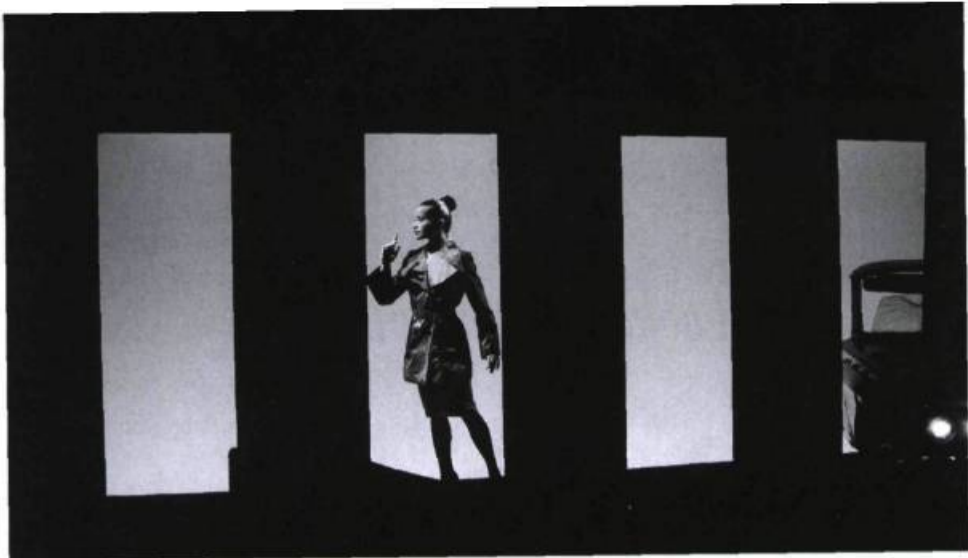
Look, de Bob Wilson, aux Galeries Lafayette.

de Robert Wilson. Ici, les décors, les éclairages, les volets qui s'abaissent et se lèvent cependant que derrière on procède à des changements rapides de modèle, tout dit la théâtralité non seulement des lieux mais des actions qui prennent place chacune dans son cadre. Les mannequins avoisinent les acteurs dans des positions sculpturales, et l'on hésite parfois à déterminer qui du mannequin ou du comédien a le plus de réalité. Comme porte d'entrée à ces diverses scènes, une forêt de bouleaux plantés en terre et portant chacun autour du tronc un vêtement différent de grand couturier. Au centre, partageant les différentes scènes, des écrans de télévision reproduisant des corps masculins ou féminins présentés en une seule image fragmentée sur plusieurs écrans paient leur tribu à Nam June Paik et à l'art vidéo.