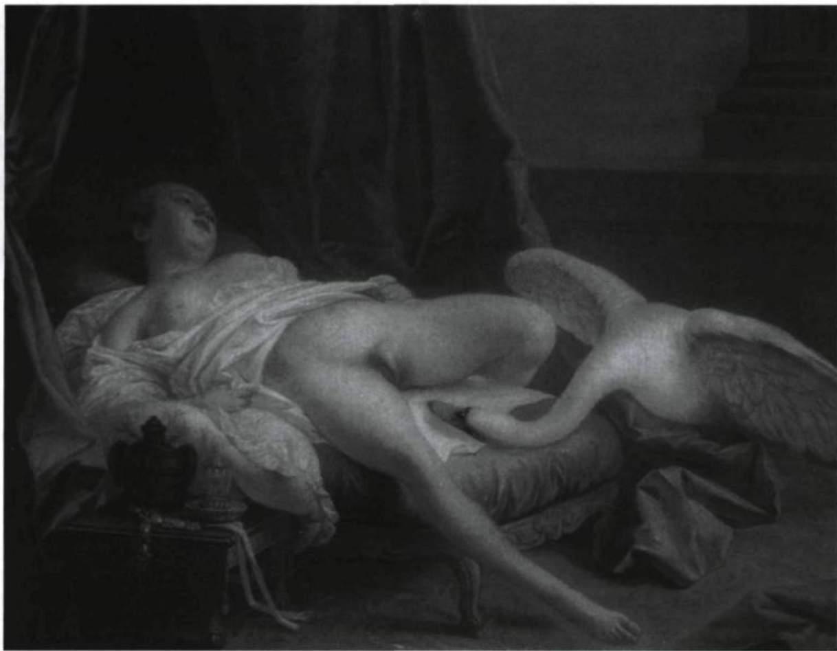
Boucher, Léda . Huile, coll. particulière.