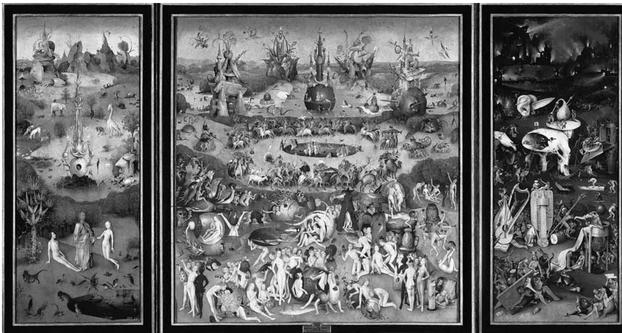
Jérôme Bosch, le Jardin des délices , v. 1500-1505. Musée du Prado, Madrid.