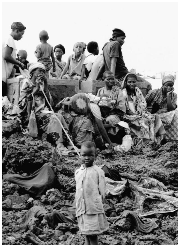
« Le radeau de la Méduse », République du Congo. Cliché tiré du parcours photographique de Philippe Ducros, la Porte du non-retour (Productions Hôtel-Motel), présenté à l'occasion du FTA 2011.

On le dit de plusieurs, souvent à tort et à travers, mais dans son cas, c'est indubitable : Ducros est un artiste et un citoyen engagé. Nord-Américain nanti, choyé mais conscient de l'être, il est préoccupé par le sort du monde, broyé par les injustices que nous cautionnons tous plus ou moins consciemment. Ici comme ailleurs, le créateur est un éveillé de consciences. Souvent éprouvantes, parce que pleinement humaines, c'est-à-dire abondant de front ce qu'on qualifie commodément d'inhumain, sciemment détournées du divertissement et des bons sentiments, abreuvées de souffrance tout en faisant la part belle au pardon et à la résilience, les créations de Ducros sont névralgiques, essentielles à notre époque. ■