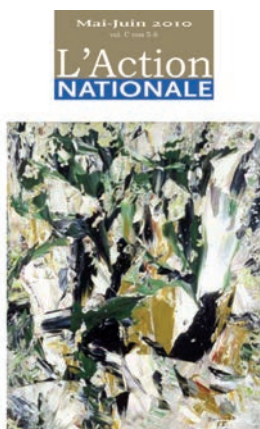
Pierre Vadeboncoeur, un homme libre