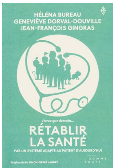
RÉUSSIR L'ÉDUCATION (164 PAGES) GENEVIÈVE DORVAL-DOUVILLE ET JEAN-FRANÇOIS GINGRAS