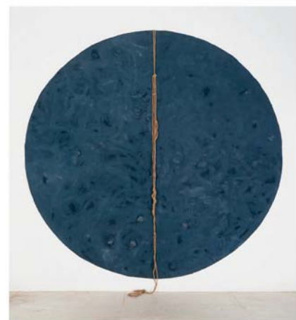
Élections 2018 Horizon et perspectives