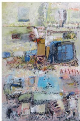
Élections 2018 Le tournant