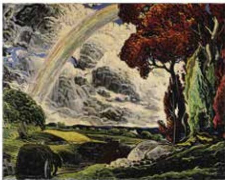
Marc-Aurèle Fortin, L'Arc-en-ciel, 1934 ou 1935 © Fondation Marc-Aurèle Fortin / SOCAN (2000)