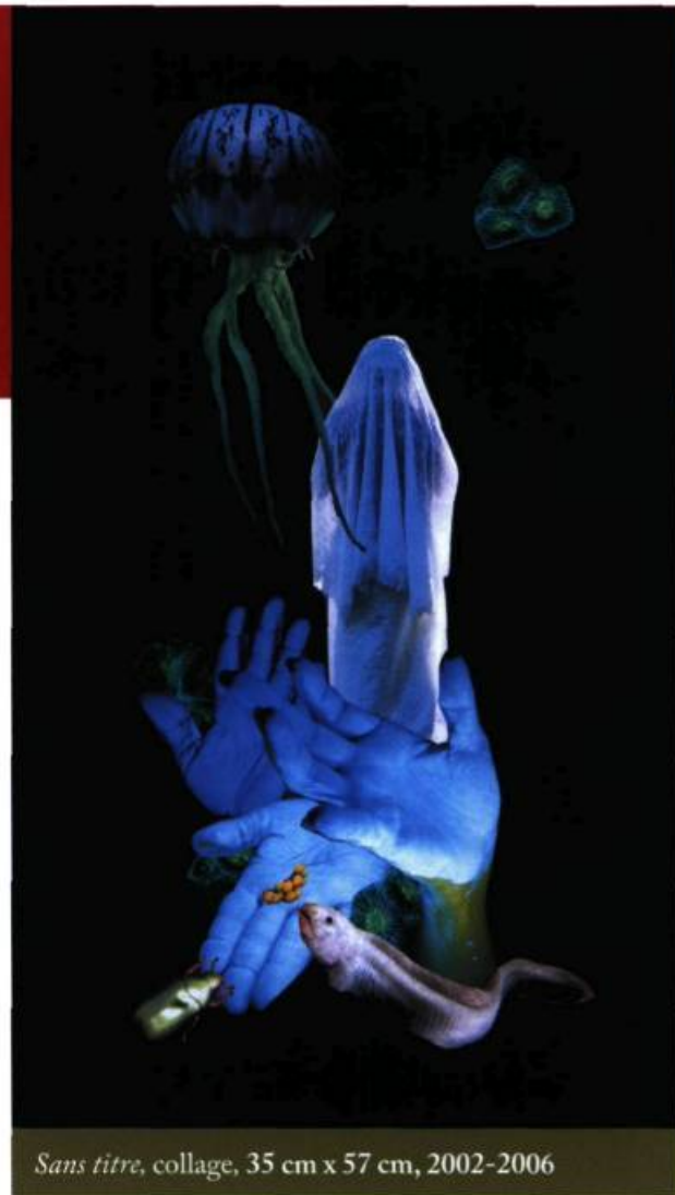
Sans titre, collage, 35 cm x 57 cm, 2002-2006