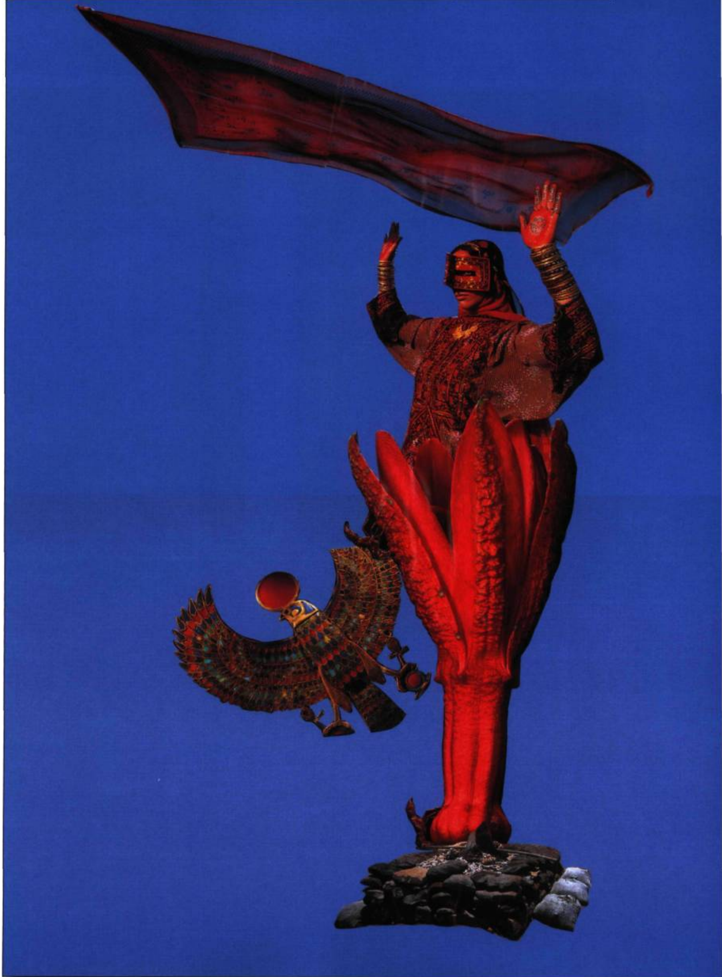
Sans titre Collage 38 cm x 51 cm 2002-2006