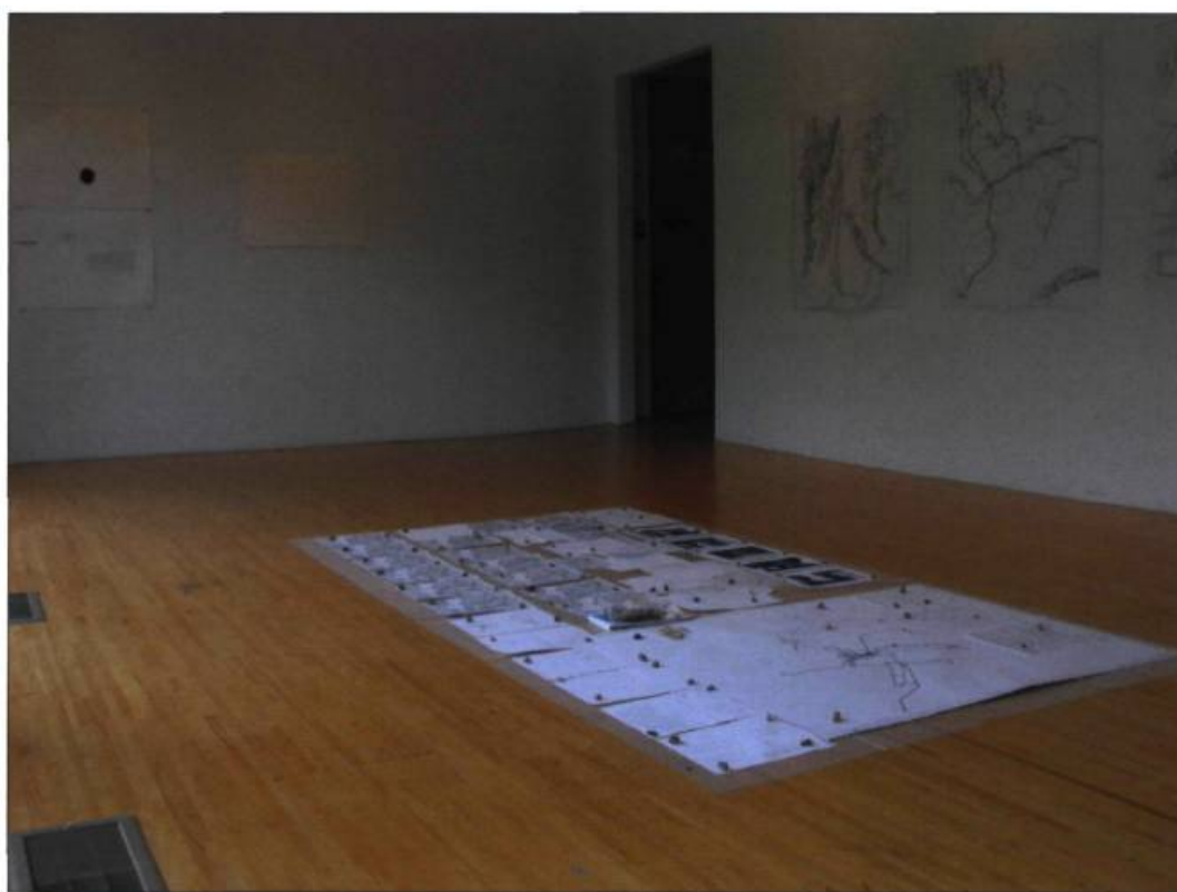
PHOTO DE LA PAGE DE GAUCHE ET PHOTO DU HAUT DE LA PAGE DE DROITE : archive haut-parleurs, fils, accumulation d'enregistrements sonores dans la région sur une période de temps, mai – juin 2009.