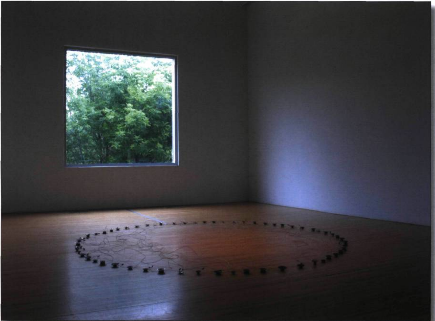
live microphone, transmetteur FM, haut-parleurs, fils 2009

marche sur du silence en voie de disparition. Puis on découvre l'autre archive, celle faite de papier où se trouvent les dessins des participants et de l'artiste, des plans aux trajets colorés en bleu posés sur le sol. Une constance géométrique s'installe : des cercles partout. Comme les empreintes digitales du bruit, des ondes reproduites à l'infini sur des partitions vierges.